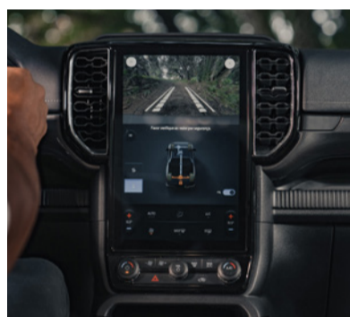
Navegador Off-road, a ferramenta perfeita para explorar os terrenos mais desafiadores.