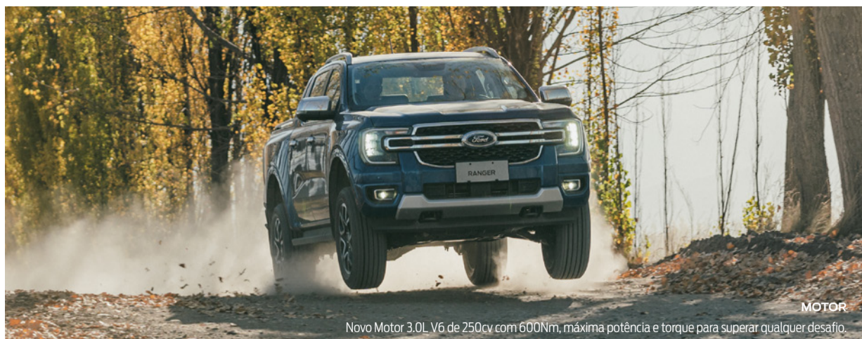
MOTOR Novo Motor 3.0L V6 de 250cv com 600Nm, máxima potência e torque para superar qualquer desafio.