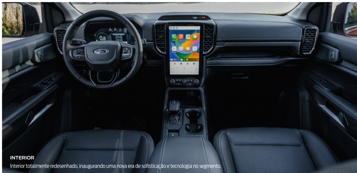
INTERIOR Interior totalmente redesenhado, inaugurando uma nova era de sofisticação e tecnologia no segmento.