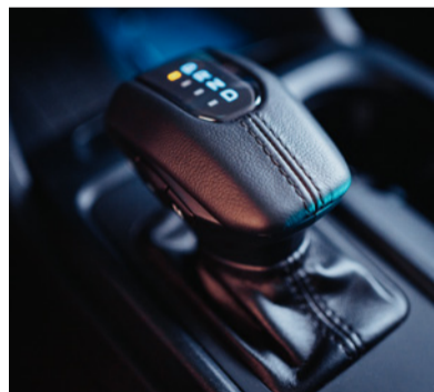
Cambio eletrônico de 10 velocidades.