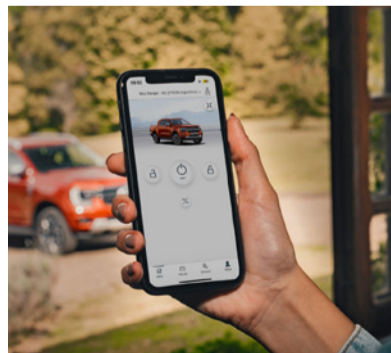
Conectividade via aplicativo Ford Pass™